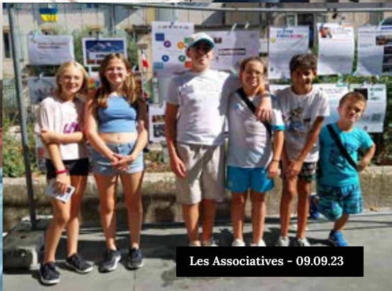
Les Associatives - 09.09.23