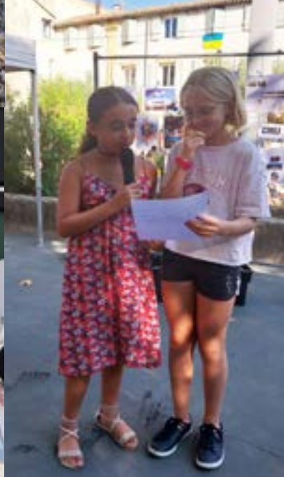
Préparation des Associatives